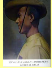
रा0मै0 गबर सिंह, विक्टोरिया कास (मरणोपरान्त)