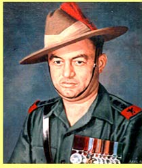
ले कर्नल डी एस थापा, परमवीर चक