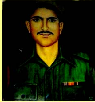
नायक भवानी दत्त जोशी, अशोक चक (मरणोपरान्त)